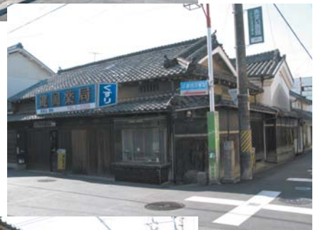
鍵岡分家は天保12年（1841）頃の建築