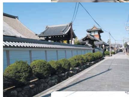
本誓寺・浄照寺が並ぶ寺前通り