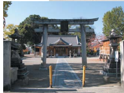
「祇園さん」として親しまれる津島神社