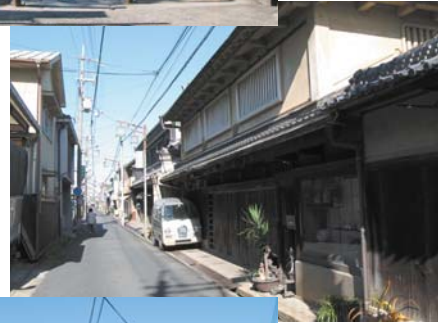
材木町界隈の町並み