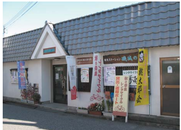
田原本の情報拠点「観光ステーション磯城の里」

この施設は町商工会の空き店舗利用計画の一環として、商店街の活性化を図るため、設置されたもので、同町商工会や自治会、そして行政など、まちづくりを担う人々の様々な活動の拠点でもある。