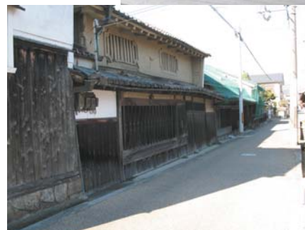
損傷の激しい竹村本家住宅