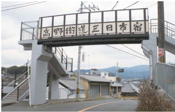
整備された歩道橋