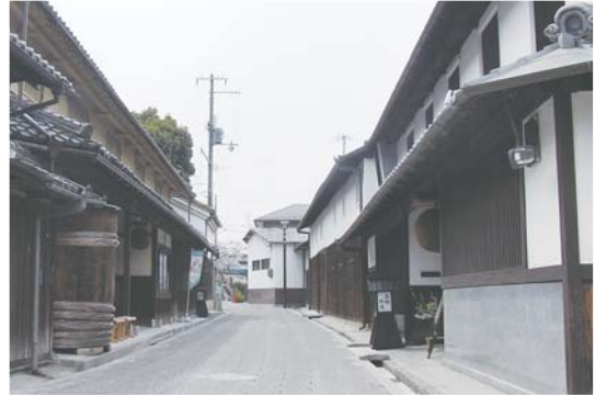
整備前（上）と整備後（下）の酒蔵ゾーン