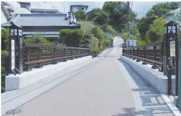
整備された旧西條橋

街道の雰囲気に合わせて街道上の橋（旧西條橋）の修景整備を行い、初夏にはホタルが舞う水辺の景観を演出している。