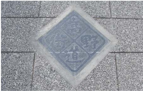
地面に埋められた道しるべ

高野街道の景観にふさわしい街灯や案内板・道しるべ・デザインマンホール蓋・埋込型道しるべ等を設置して、来訪者が地図を持たずに安全に楽しく歩ける環境を整備する。