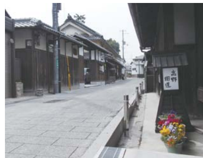
街道に設置された屋形型灯ろう

民家から灯ろうで街道を照らす住民の取り組みを行うために、高野街道のロゴを入れた屋形型灯ろうを市が作成し、街道沿いの住民に貸与。灯ろうの電気代は住民に負担してもらいながら街道の夜の景観づくりに取り組んでいる。