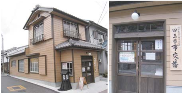
整備された旧三日市交番