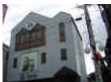
ほんまちコミュニティホール

片塩駅前商店街にあり、今年10月にオープン。“市民の集いの場”をテーマに、くつろげるサロンを設け、ギャラリーとして、憩いの場、発表の場として利用できる。