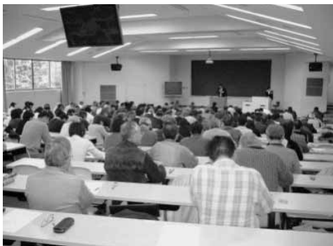
奈良通めざして集まった受験者たち（奈良大会会場）

大学など奈良市内4大学を会場として行われた。当日の受験者は3,544人で、受験率87.7%だった。