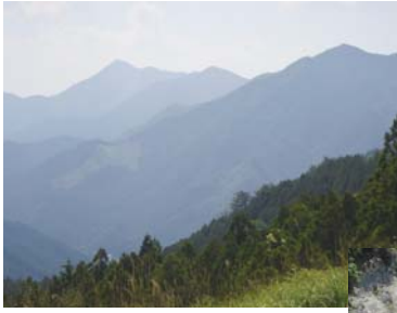
三峰山から台高山脈方面を望む。左奥の三角形の頂が「高見山」。