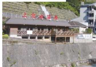
神武天皇の伝承が残る薬師湯（上北山温泉）