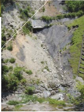
月出の中央構造線露頭。日本海側と太平洋側の変成岩層がぶつかる。(点線部)