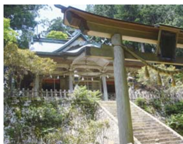
熊野三山の奥の院「玉置神社」

この北東面にそびえるのが日本一の多雨地帯で、秘境とされた「大台ヶ原」である。隆起準平原と呼ばれる地形で、平原が地殻変動で隆起しさらに長年にかけて浸食され深い溪谷を刻んだもので、天気の良い日には吉野の山々や熊野灘方面を見渡すことができる。伝承では、神武天皇が国見をした所といわれ、山上の「牛石ヶ原」には、明治期