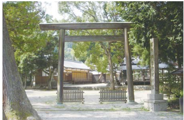
神武軍が拠点とした阿紀神社（大宇陀迫間）。この一帯の阿野野は皇室の狩場として万葉集などにも登場する。

そこで、お告げの通り、敵陣を突破して持ち帰った埴土で器を作り、丹生の川上で天神地祇を祀った。また、菟田川の朝原では「水沫の様にかたまり着くところ」があり、戦勝を祈祷したところ、願いの通り、平瓦で水無しで飴を作り、さらに御