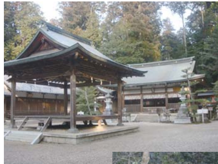
都祁水分神社（上）と「聖武天皇堀越頓宮之跡」碑（右）

都が飛鳥、藤原京にあった時代には、齋王の往還は初瀬から宇陀を通ったが、平城遷都後はやや遠回りとなるため都祁山乃道が使われた。