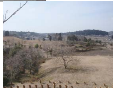
三陵墓東古墳から西古墳と都介野を望む

り、冬の氷を保存する氷室が存在したのは明らかで、允恭天皇期（5世紀）創祀とされる「氷室神社」（天理市福住町）は水の神を祀る神社である。