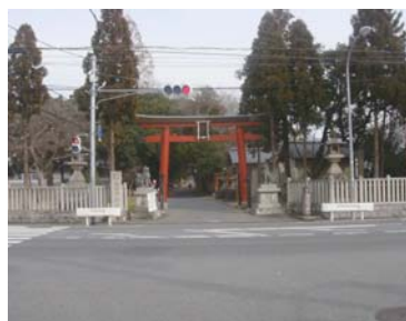
和邇下神社参道と国道169号線