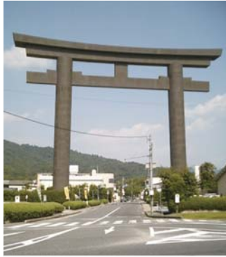
大神神社の大鳥居と参道