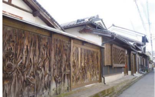
本町通のまちなみ

これを受けて、同市はエルト桜井内に新たな人の流れを生み出し、付近に賑わいをもたらすような公共空間の構築を検討している。また、街道沿いの町家等、地域資源を活かした景観形成により、同地区の活性化につなげる方針である。