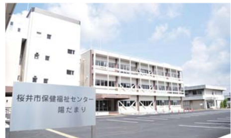
健康・子育て・医療・福祉の中心拠点「陽だまり」

また、旧奈良県桜井土木事務所は地域防災の拠点施設として改修され、桜井消防署が移転し、本年1月19日から運用開始されている。