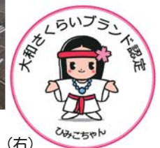
「大和さくらいブランド」ロゴマーク（右）

桜井市は、ロードサイドや住宅地、中心市街地、観光地、中山間地と多様な地域を抱えているため、まちづくりの方向性は地域によりおのずと異なる。しかし「新しい人の流れ」を生み出しまちの賑わいをつくる、という点で市の姿勢は一貫している。