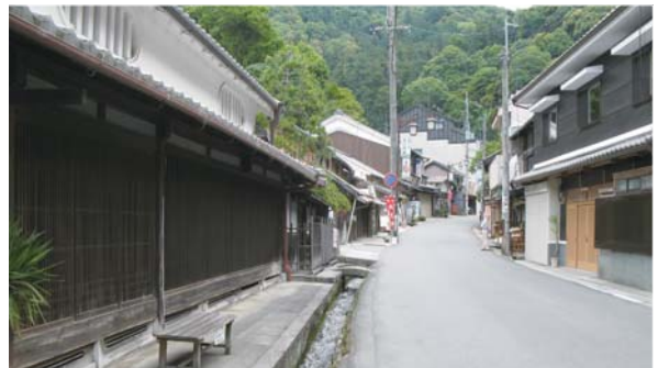
長谷寺門前町のまちなみ

市はかねてから地元自治会や観光協会、旅館組合、NPO等とともに「初瀬門前町景観まちづくりの会」を発足、まちの活性化を図っている。今後、県からの支援を受けながら参道・小道の整備や電柱の移設、町家外観の補修等を行い、まちの魅力を高めて来訪者を呼び込むとともに、定住希望者と町家所有者とのマッチング支援を行うこととしている。また、自動車で混み合う参道に対する交通規制の実施検討や、渋滞緩和につながる白河バイパス（県道桜井都祁線）全面開通に向けて県への要請を進めている。