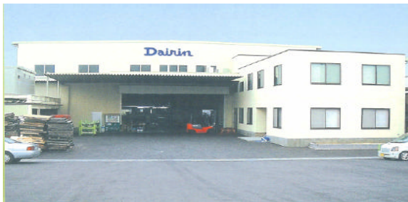
昨年完成した第 2 工場

会社名：大倫企業株式会社 所在地：奈良県大和高田市東中 99-4 設立：昭和 47 年 9 月 電話：0745-56-9333 FAX：0745-52-9345 資本金：1,000 万円 社長：石川 俊夫 従業員：70 名 事業内容：プラスチック押し出し成型、プラスチック射出成型、発泡押し出し成型および加工