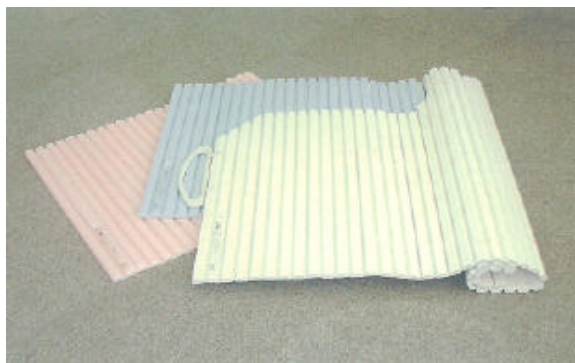
同社の主力製品シャッタータイプの「風呂フタ」

取り付けることができた。現在では販路は大きく拡大し、大手量販店をはじめ大手住宅メーカーや大手浴槽メーカーなど15社と取引をしている。