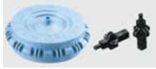
【ハマクロンパーツ】