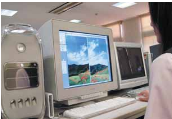
明新プライマリーカラー（原色）システムによる画像の変換

ただ、7色印刷のデータを作成するためには画像を変換するシステムが必要であるので、同社で独自にシステムを構築し、それを「明新プライマリーカラー（原色）システム」と名付けた。