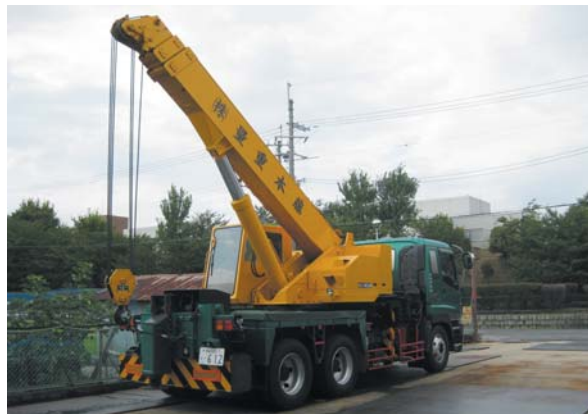
＜所有重機の一部＞ 門型リフター（上）とユニック車（下）