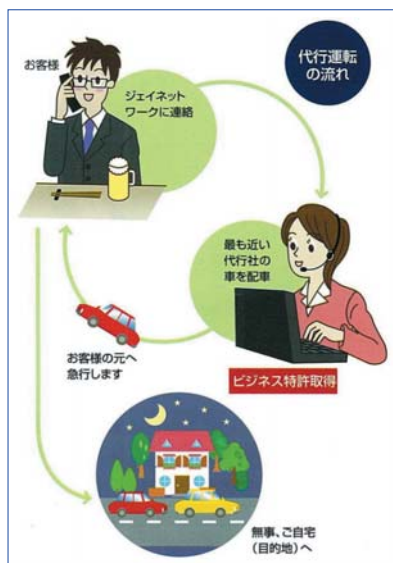
GPSを利用した代行運転配車の流れ

同社が提供するサービスの要は、申込みから配車までのスピーディーな対応である。お客様から電話で同社に代行運転の依頼が入ると、オペレーターがモニターとGPS機器を用いて、お客様に最も近い代行業者の車を探し出し、お客様のもとへ向かうように指示、指示を受けた車がお客様のところへ急行するというしくみ。これにより、こ