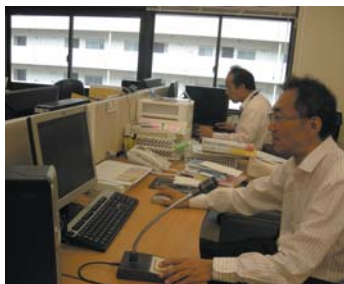
GPS機能を活用して配車を行うオペレーター(左)

れまで「長時間待たされる」と苦情の多かった待ち時間を20分以内に短縮することが可能となった。