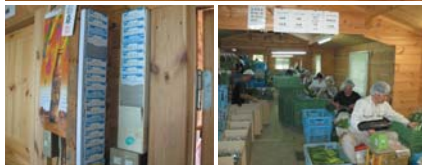
作業場入り口にある「社訓」(上)とタイムカード(左下)。右下は作業場の袋詰め風景。

4年前に法人格を取得し、今では社員とパートタイマーを合わせて29人を雇用する。勤務時間(8:00~17:00)、休日(隔週2日制)など一般の事業所とほとんど変わらない勤務条件で社員を遇する。