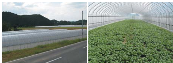
宇陀の山あいのきれいな水と空気で育てられる有機野菜

食の安全・安心に対する消費者の意識が高まる中、禁止された農薬や化学肥料を使わない有機農業で安全でおいしい農産物を消費者に提供しているのが、宇陀市の有限会社山口農園である。ハウレン草や小松菜などの軟弱野菜とクールミントやローズマリーなどのハーブ類など30種類以上の作物を77棟のハウス(32,000㎡)と露地(3,500㎡)で生産している。