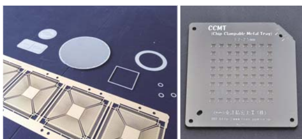
金属エッチング事業のリードフレーム、治具等

我々が造っている製品は全て生産材ですから、一般の人の目に触れる機会がありません。売上に占める割合は、エッチングが約1/3、大手電機メーカーの工場内で生産している CIS（密着イメージセンサー：イメージスキャナ等で用いられる読み取り機構の方式の一つ）が約1/3、残りがフォトマスクや回路基板等です。特にセラミックス回路基板は、安定性・耐久性に優れており、高い信頼性が要求される通信基地局や人工衛星等の分野でも使用されています。