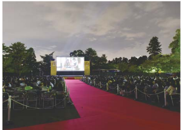
なら国際映画祭の上映風景

「奈良を世界に発信したい。また世界的に活躍できる若い人を育てたい」という思いで始めました。2010年にスタートして以来、なら国際映画祭に映画監督や関係者として参加した若手が、徐々に育ってきています。また招聘した海外の映画監督が世界で活躍する話も聞こえてきます。