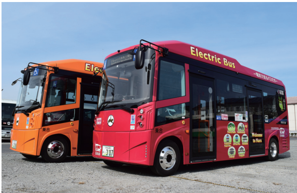
2023年2月より導入されたEVバス

減るかもしれません。まだ発展途上のところもあり、充電時間や航続距離の問題など課題はありますが、技術の進歩とともに徐々に解決されていくと思いますので、これからも技術の進展を見ながら力を入れていきたいと思っています。