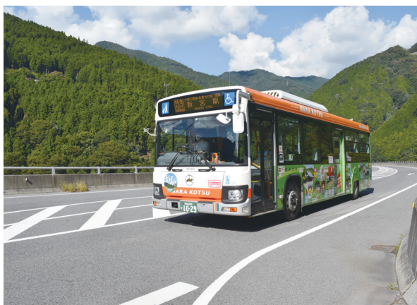
「新宮駅行き」の長距離路線バス

時の大仏新宮線の運転手第1号に選んでもらって、今でもその事を若いころの誇りにしています。」と懐かしそうに話してくださいました。このような大先輩とのつながりも80周年という行事がなければ表に出てこなかったと思います。単なる記念日を祝うイベントではなく、その裏側には80年間共に働いて支えてくれた人たちがいます。奈良交通を退職された多くの方にもご協力いただきましたが、その日は皆さん現役に戻られたような感じがしました。先輩方との関係にも厚みができ、会社の活力アップにも非常に良い機会となり、改めて当社を支えていただいている方々に対する恩返しになったと思っています。